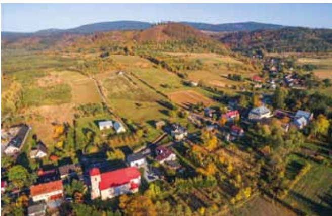
Goworów z lotu ptaka