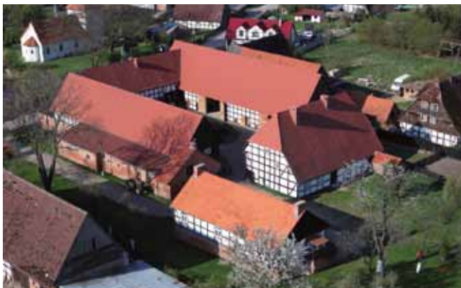
Zagroda Albrechta z XIX w.