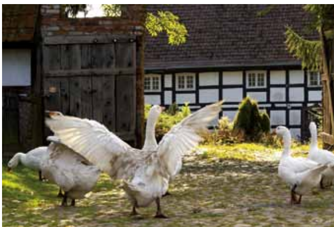
„Żywa zagroda” w Swołowie