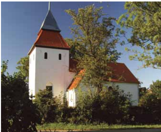
Kościół pw. Wniebowzięcia NMP z XIV w.